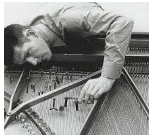
John Cage, obra 4'33, 1952