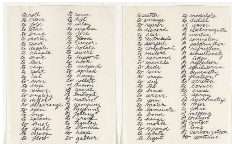
Richard Serra, Verb List, 1967