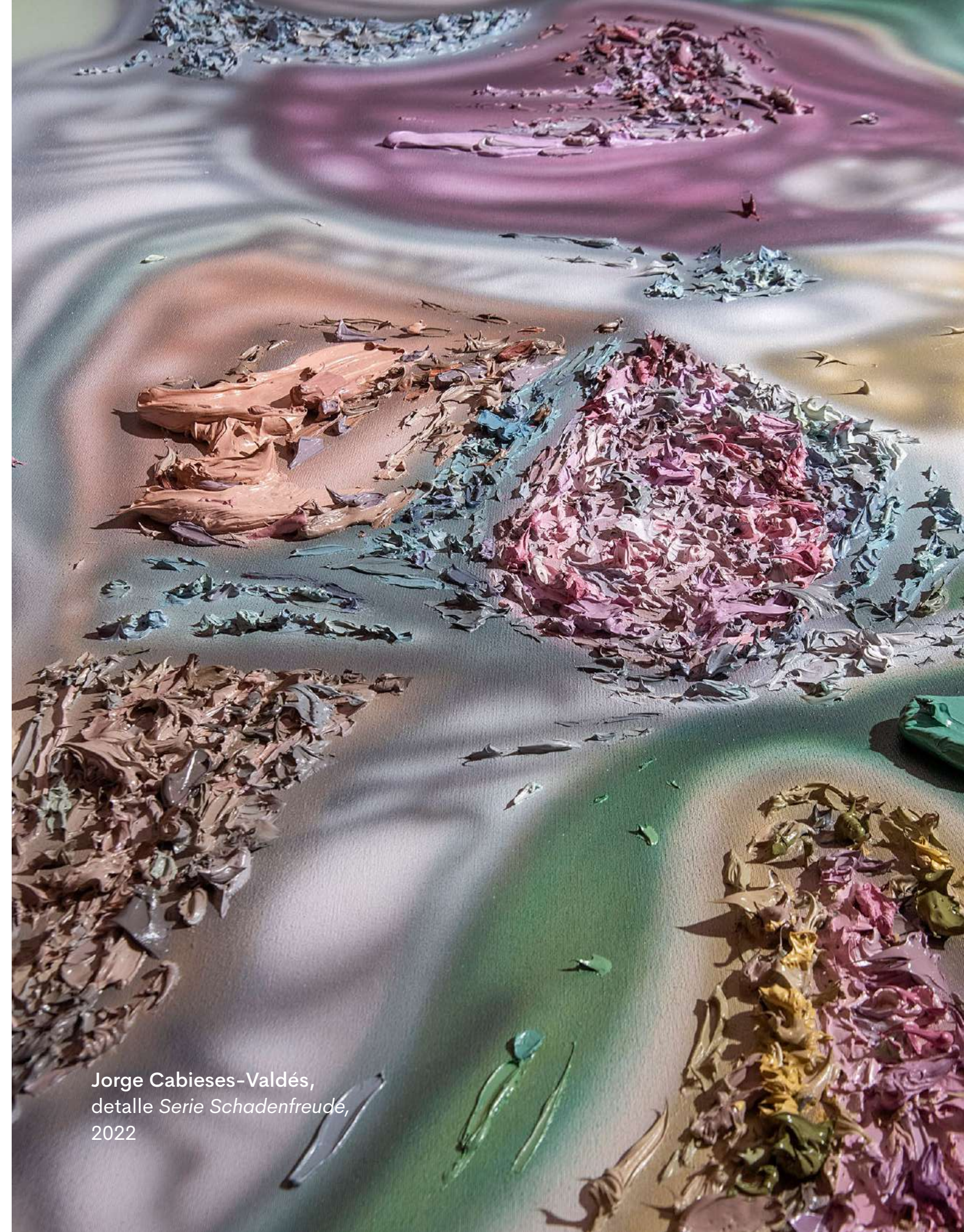
Jorge Cabieses-Valdés, detalle Serie Schadenfreude, 2022