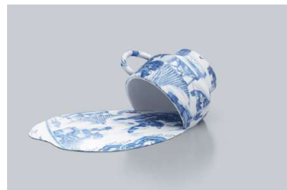
Livia Marín, Broken Things (cerámica), 2017-18

La nostalgia, los objetos y la intervención se puede vincular a la obra de la artista chilena Livia Marín, quién también trabaja con objetos domésticos frágiles, reflexionando en torno a la ruina, el cuidado y la relación emocional que puede aparecer con los objetos. Es interesante cómo un tema similar es abordado con obras que se diferencian bastante entre sí, dando cuenta de las posibilidades que ofrece la creatividad.