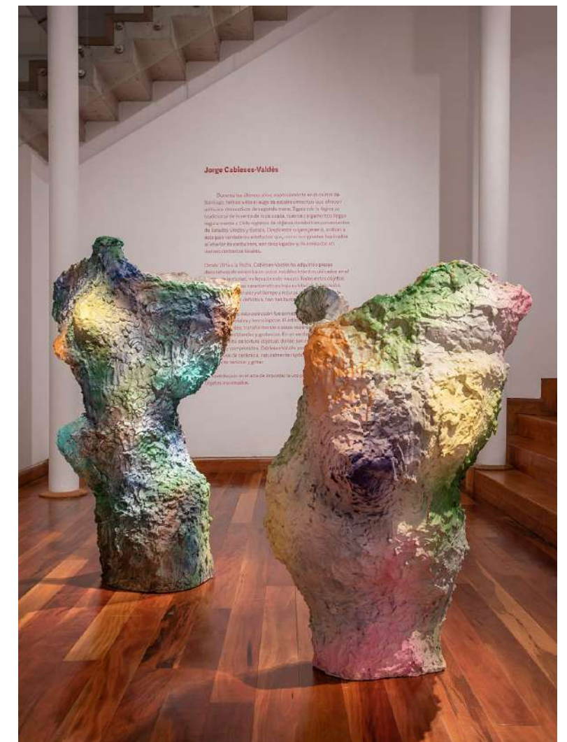
Jorge Cabieses-Valdés, Serie Schadenfreude , 2022